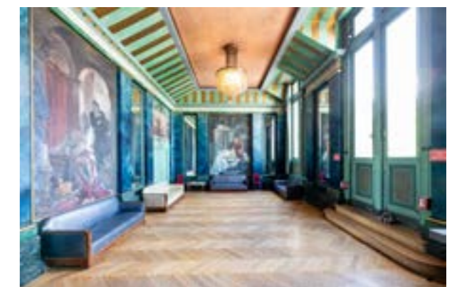
GRAND FUMOIRRR 80 PERSONNES