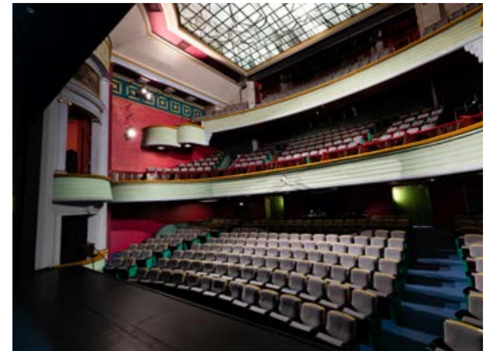
SALLE PRINCIPALE 523 PLACES