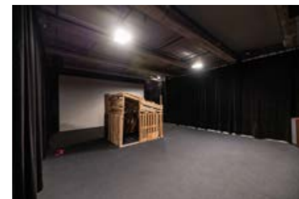
GRRROTTE 50 PERTSONNES