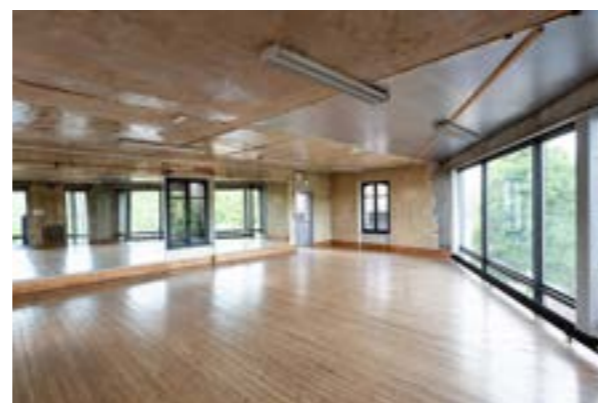
SALLE DE DANSE 80 PERSONNES